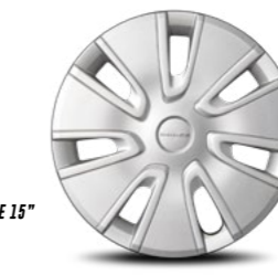
// ALUMINIO DE 15" PARA SXT