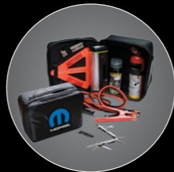
// KIT DE EMERGENCIA