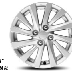
// ACERO DE 14" CON TAPÓN PARA SE