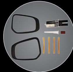
// PROTECTORES DE ESPEJOS