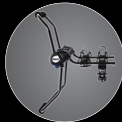
// RACK PORTABICICLETAS