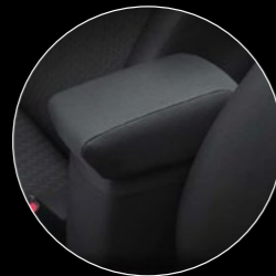
// CONSOLA DESCANSABRAZOS

Haz a tu Dodge Attitude más atractivo, funcional y seguro. Pero sobre todo, personalízalo con accesorios MOPAR®.