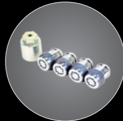
// BIRLOS DE SEGURIDAD